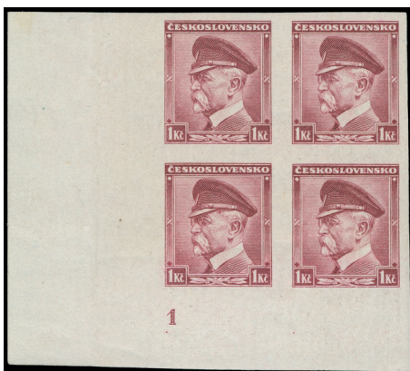
Obr. 3 Rytina K. Seizingera. Čtyřblok ZT s DČ „1“. Doposud a pravděpodobně jediný známý zkusmý tisk s deskovým označením.