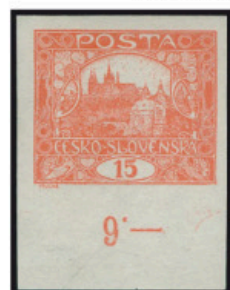
15 h hnědočervená – neperforovaná, s předtiskem „9“. Výskyt: neperforovaná, 76. ZP 7.TD. Někdy vyznačená spirálou. Výskyt: neperforovaná, 77. ZP 7.TD.