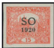
15 h hnědočervená – neperforovaná, s předtiskem „SO 1920“, 36. ZP 7.TD. Přetisková deska B/1b. Na tomto ZP je retuš 5. spirály. Raritní výskyt.