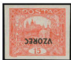
15 h cihlově červená – neperforovaná, převrácený předtisk VZOREC, 49. ZP 7.TD. Velmi vzácný výskyt – I. spirálový typ.