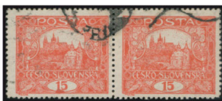
15 h cihlově červená – základní odstín 15h – 15h, 40 a 20 7.TD – společný typ Na horním okraji je upravená deska 15h – 15h, 40 a 20 7.TD – společný typ 15h – 15h, 40 a 20 7.TD – společný typ