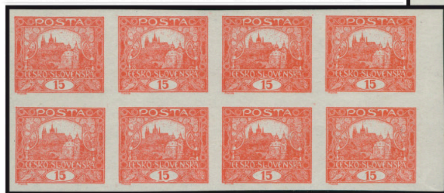
Pravý vodorovný 8blok, 15 h hnědočervená – neperforovaná, 67. – 70., 77. – 80. ZP 7.TD. Jeden z mála větších bloků.

☉ - známka vyznačená červenou nebo černou spirálou, ☉+☉ - známka vyznačená spirálou