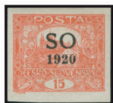
15 h hnědočervená – neperforovaná, s předtiskem „SO 1920“. Výskyt: 28. ZP 7.TD. Právě taková známka 15 h. Někdy vyznačená spirálou. Výskyt: neperforovaná, 29. ZP 7.TD.