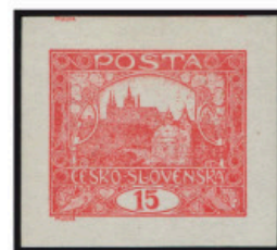
15 h cihlově červená – neperforovaná, 28. ZP 7.TD. Někdy vyznačená spirálou. Výskyt: neperforovaná, 29. ZP 7.TD. Někdy vyznačená spirálou. Výskyt: neperforovaná, 30. ZP 7.TD.