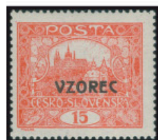
15 h cihlově červená – neperforovaná, převrácený předtisk VZOREC, 49. ZP 7.TD. Právě taková známka.