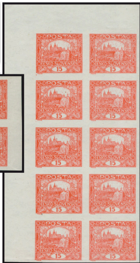
Levý horní svislý 10blok, 15 h cihlově červená – neperforovaná, 1., 2. – 41., 42. ZP 7.TD. Doposud největší známý celek. V uvedeném barevném odstínu velmi vzácné.