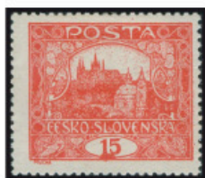
15 h cihlově červená – základní odstín 15h – 15h, 40 a 20 7.TD – společný typ Na horním okraji je upravená deska 15h – 15h, 40 a 20 7.TD – společný typ 15h – 15h, 40 a 20 7.TD – společný typ

Známky 15h „Hradčany“ ze 7. tiskové desky jsou známy ve třech barevných odstínech, a to v barvě cihlově červené, hnědočervené a červenohnědé. Známky v jakémkoliv barevném odstínu ze 7. tiskové desky jsou vzácné. Dva poslední jmenované odstíny se vyskytují u 1. a 2. tiskové desky ojediněle. U 7. tiskové desky je však situace opačná. Základní odstín, tedy barva cihlově červená, je svým zastoupením nepoměrně vzácnější.