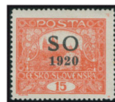
15 h hnědočervená – rádkové zoubkování 13%, s přetiskem „SO 1920“, 83. ZP 7.TD. Přetisková deska B/2b.