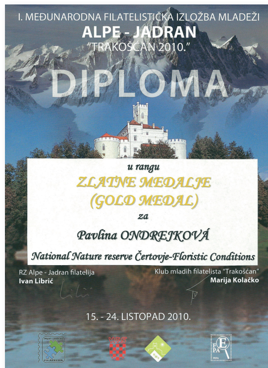
Diplom ke zlaté medaili z výstavy na hradě Trakošćan v Chorvatsku