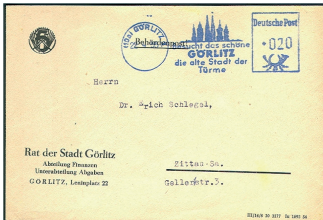
Obr. 7. Služební dopis vyplacený OVS v modré barvě, razítko Görlitz 22. 4. 55 ještě se starým směrovacím číslem (10a).

Jak jsem již uvedl, podniky mohly svoji služební korespondenci vyplácet i otiskem výplatního stroje za podmínek, že otisk bude proveden v modré barvě (obr. 7). V provozu bylo celkem 5 různých typů výplatních strojů od 4 různých výrobců (Anker, Bafr, Anker & Bafr, Postalia), které specialisté dále rozlišují podle typů použitého písma, velikosti pseudoznámky a různých druhů počítadel.