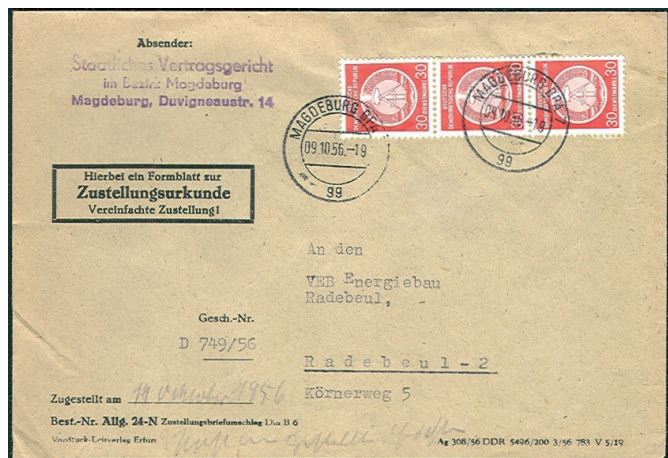
Obr. 6. Úřední dopis s doručenkou, poštovné 90 Pf, vícenásobná frankatura známek I. emise (3x Mi. 11), razítko Magdeburg BPA 7 / 9. 10. 56.

Volný prodej služebních známek u poštovních a filatelistických přepážek byl zakázán. Známky mohl pro oprávněný podnik, úřad či instituci odebrat pouze pověřený a ze státněbezpečnostního hlediska pro-