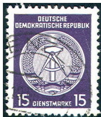
Obr. 4 II. vydání služebních známek, knihtisk, kat. Michel č. 21.

Jednotlivá vydání se vzájemně liší použitým druhem tisku (ofset nebo knihtisk - viz obr. 3 a 4), různými tvary zobrazeného kružítka v souvislosti s úředními změnami v provedení státního znaku NDR, několika druhy použitých papírů (obyčejný, rýhovaný, žilkovaný), různými průsvitkami (navíc všechny s vodorovnou i svislou polohou) a celou řadou dalších odchylek. To vše nabízí sběratelům služebních známek NDR téměř neomezené možnosti specializace a plné filatelistické využití. Podrobnější informace k jednotlivým vydáním by vydaly na samostatný článek, proto na závěr této části alespoň dva zajímavé dopisy vyplacené těmito známkami - viz obr. 5 a obr. 6.