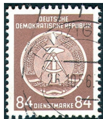
Obr. 3 I. vydání služebních známek, ofset, kat. Michel č. 17.

První emise služebních známek se státním znakem NDR (Michel č. 1 – 17) byla vydána 15. 8. 1954. Všechny katalogy Michel Deutschland vedou tuto emisi pod označením Dienstmarken A (spolu s upřesňujícím, mezi filatelisty vžitým názvem „Verwaltungspost B“). Katalog Michel [4] eviduje čtyři, specializovaná literatura [5] dokonce pět různých vydání těchto známek, které jistě i u nás každý dobře zná. Známky vycházely postupně v letech 1954 (Michel č. 1 – 17), 1954-1955 (Mi. č. 18 – 27), 1956 (Mi. 29 - 33) a 1957-1960 (Mi. č. 34 – 41). S výjimkou I. emise dokonce bez oficiálního uvedení data jejich platnosti, což při německé pořádkumilovnosti je na pováženou.