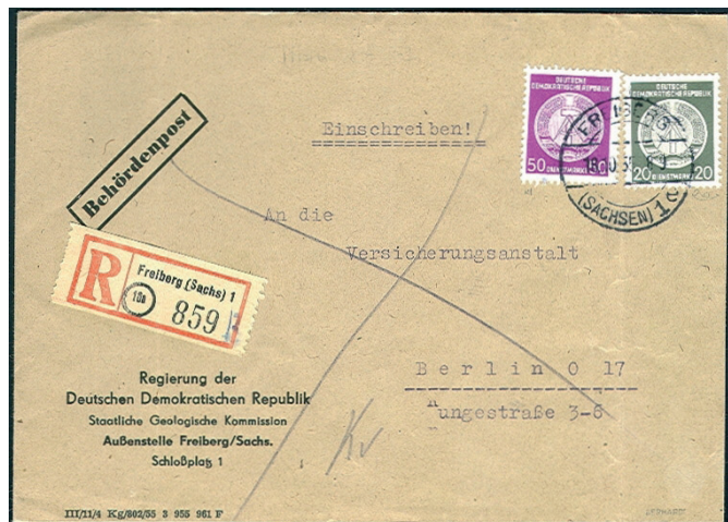
Obr. 5. Doporučený dopis z roku 1955, poštovné 70 Pf, smíšená frankatura I. a II. emise Mi. 8 + 27, denní razítko Freiberg (Sachsen) 1 / 18. 10. 55.

Jednotlivá vydání se vzájemně liší použitým druhem tisku (ofset nebo knihtisk - viz obr. 3 a 4), různými tvary zobrazeného kružítka v souvislosti s úředními změnami v provedení státního znaku NDR, několika druhy použitých papírů (obyčejný, rýhovaný, žilkovaný), různými průsvitkami (navíc všechny s vodorovnou i svislou polohou) a celou řadou dalších odchylek. To vše nabízí sběratelům služebních známek NDR téměř neomezené možnosti specializace a plné filatelistické využití. Podrobnější informace k jednotlivým vydáním by vydaly na samostatný článek, proto na závěr této části alespoň dva zajímavé dopisy vyplacené těmito známkami - viz obr. 5 a obr. 6.