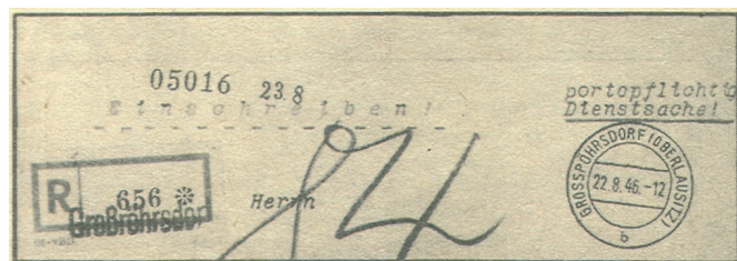
Obr. 1. Část služebního dopisu z r. 1946, poštovné 84 Pf vyznačeno modrou tužkou, označení zásilky „Portpflichtige Dienstsache“ provedeno psacím strojem.

Pokud jde o přepravu služebních zásilek v Německu po II. světové válce, situace byla od samého začátku poměrně komplikovaná a zejména v 50. letech docházelo k poměrně častým systémovým změnám. Bezprostředně po skončení války (v období od 8. května do 22. října 1945) byly všechny důležité zásilky přepravovány téměř výhradně kurýry, neboť poštovní síť v celém Německu byla prakticky rozvrácena. V sovětské okupační zóně vydala Ústřední správa pro poštu a telekomunikace dne 22. října 1945 nařízení, podle kterého veškeré kontrolní orgány a organizace spojeneckých mocností mohly u poštovních úřadů v sovětské zóně podávat své služební zásilky bezplatně. Rovněž všechny státní orgány musely své listovní zásilky, adresované fyzickým i právnickým osobám, výrazně označit jako „Portpflichtige Dienstsache“ (rukopisně, razítkem, psacím strojem) a tyto podávat rovněž nevyplacené (viz obr. 1, převzatý z časopisu Sammlerexpress č.4/1977). Výše poštovného byla na těchto zásilkách vyznačena modrou tužkou a hradil je příjemce zásilky v normální výši, bez doplatného. Jako nevyplacené byly též přepravovány služební zásilky orgánů a organizací německé pošty, na kterých kromě úředních razítek musela být i poznámka „Postsache“ (= Věc poštovní služby).