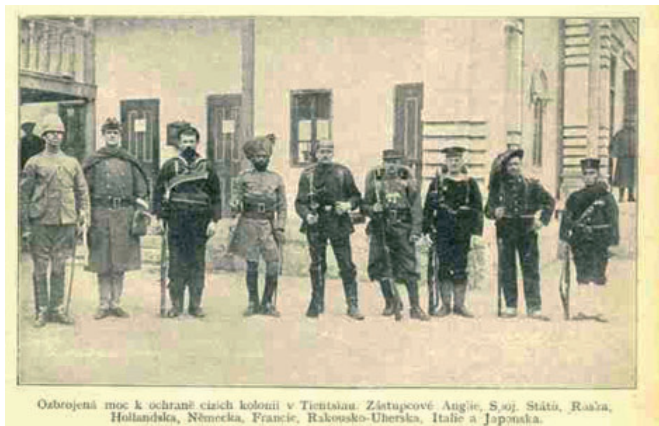
Obr. 7. Obrázek spojeneckých vojáků v Číně.

Čína musela přijmout na své území cizí vojska, která zde setrvala řadu desetiletí (obr. 7) – např. americké jednotky zde působily do roku 1938 a pak ještě v období 1944-48. Velký vliv v zemi získalo Japonsko, které jej uplatňovalo prakticky až do roku 1945.