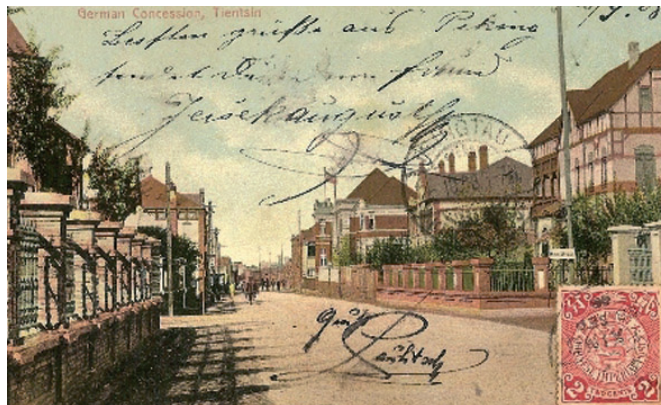
Obr. 4. Dobová pohlednice Tientsinu.

Po této válce následovala čínsko-japonská válka 1894-95 o vliv obou zemí v Koreji, kterou Čína prohrála a jejíž mírové podmínky byly pro tuto kdysi mocnou zemi ponižující. Za čínské zájmy musely u Japonska intervenovat Německo, Rusko a Velká Británie, kterým se podařilo nakonec mírové podmínky o něco zmírnit. Všechny 3 země dostaly za tuto pomoc (a za vraždu dvou německých mnichů v roce 1897) od čínské vlády královskou odměnu: od roku 1897-98 získaly do pronájmu Port Arthur (Rusko), Tientsin (Německo; obr. 4), Kuang-čou (Francie) a Wej-chang-wej (V. Británie).