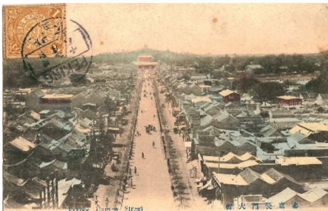
Obr. 2. Dobová pohlednice Pekingu

Nejprve trochu informací o historii Číny. Počátky čínského státu spadají do prehistorické doby 1776-1000 před naším letopočtem, kdy v severní Číně vládla první dynastie Šang. Během svých dlouhých dějin probíhaly v zemi občanské války, její území se třísťilo na nezávislé celky, aby bylo posléze opět spojeno silným císařem. Čína byla dokonce spravována cizími vládci (např. mongolským chánem Chubilajem v letech 1260-94), ale na druhé straně ještě před příchodem našeho letopočtu vybuodovala Velkou čínskou zeď, vynalezla kompas, zavodňovací systémy či papír. Ve 13. století dorazil v době vlády mongolských panovníků do Číny první Evropan – známý cestovatel Marco Polo. O několik desítek let později proběhlo v zemi povstání, které odstranilo mongolské vládce a nastolilo vládu dynastie Ming (1368-1644). Do té doby se datují první kontakty Číny s Portugalci (kteří jí navštívili zřejmě kolem roku 1514 a kteří získali roku 1557 jako svou kolonii čínské Macao). Vláda této slavné dynastie byla ukončena válkou rolníků, která vedla k nástupu nové dynastie Čching, vládnoucí Číně v letech 1644-1912 (obr. 1 a 2).