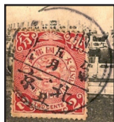
Obr. 1. Čínská známka z doby vlády dynastie Čching (použitá v Pekingu 1908).

Ačkoliv je boxerské povstání velmi známou historickou událostí, která v době svého vzniku zaměstnávala doslova celý svět, dnes po více než 100 letech není toto téma již příliš diskutované. Jedním z důvodů je významná změna postavení Číny v mezinárodních vztazích, kde se z pozice země kolonizované cizími mocnostmi přeměnila na velmoc, jejíž rozhodnutí ovlivňují prakticky celý svět. Přestože nemůžeme souhlasit s čínskou politikou v oblasti lidských práv či Tibetu, připomeňme si alespoň my, filatelisté, dobu, kdy se čínský národ teprve připravoval na svou současnou roli ve světě.