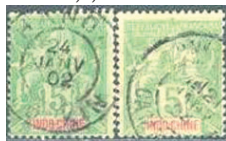
Obr. 3. Francouzské známky z Tonkinu kolem r. 1900 (razítka Hanoi a Kambodža).

Dynastie Čching se snažila zemi izolovat od vlivů jiných států, a proto v roce 1775 byly čínské přístavy uzavřeny pro zahraniční obchod s výjimkou Kantonu. Tento krok však zemi poškodil, protože nemohla profitovat se zahraničního obchodu a ztratila kontakt s vyspělými zeměmi. Evropské mocnosti si navíc tento krok nenechaly líbit a vedly s Čínou řadu válek. Důležité byly zejména 1. opiová válka 1839-42, 2. opiová válka 1856-58 a 3. opiová válka 1859-60, v jejichž důsledku musela Čína zpřístupnit své území cizincům: v roce 1842 bylo otevřeno 5 čínských přístavů pro zahraniční obchod (např. Šanghaj, Kanton, Fučou) a Velká Británie navíc získala Hong Kong jako svou kolonii. Po krátkém období relativního klidu vypukla čínsko-francouzská válka 1884-85 ( Guerre du Tonkin ; obr. 3), v jejímž důsledku Francie získala teritorium severního Vietnamu & Kambodže a navíc právo dislokovat na čínském území své vojenské jednotky, které zde zůstaly až do roku 1904. Francouzské jednotky používaly 6 razítek