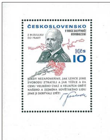
Vydaná verze aršíku (perforovaná).