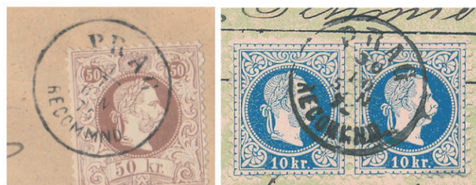
Obr. 2 Falzum razítka