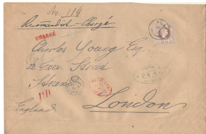
Obr. 1 Celkový vzhled padělaného dopisu, adresovaného do Londýna

Na první ukázce je zobrazen kompletní dopis, adresovaný do Londýna a frankovaný pravou známkou 50 kr. emise 1867, jemný tisk (obr. 1). Má kompletně padělané podací rekomandační razítko PRAG RECOMMND. 1/7 6 N 75 (obr. 2), dále všechna ostatní razítka (viz obr. 4 – 7) jsou taktéž padělaná, jakož i celá celistvost s ručně psanými texty. Dole pod známkou je padělaná značková značka italského znalce. Na obr. 3 přinášíme pro srovnání pravé rekomandační razítko podacího úřadu Praha na dvojpase známky 10 kr. a dále na obr. 8 reprodukci tohoto razítka z „Monografie č. známek“, díl 14 (Votoček). Zobrazená falešná celistvost byla prodána v jedné pražské internetové aukci za 15.000,- Kč + aukčními poplatky.