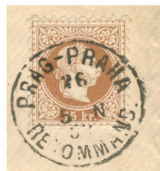
Obr. 10 Originální razítka