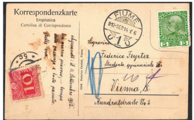
Obr. 3 Pohlednice, odeslaná z Rijeky do Vídně v roce 1914 a frankovaná dle tehdejších tarifů správně známkou 5 heller, ovšem z emise Rakouské pošty; zatíženo dopltným 10 heller.

(Faint, mostly illegible text, likely bleed-through from the reverse side of the page.)