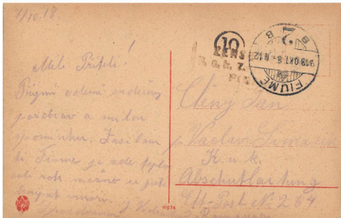
Obr. 6. Pohlednice, odeslaná z Fiume (1918), s otiskem razítka místní cenzurní stanice.

„Frankovací problém“ částečně vyřešila první světová válka – alespoň pro vojáky a vojenské námořníky, pobývající ve městě. Od 1. 8. 1914 (resp. od 9. 8. 1914 pro námořnictvo) platilo osvobození vojenských zášilek od poštovního, takže veškeré tyto zášilky byly poštou dopravovány zcela zdarma – a tím bez jakýchkoliv frankatur poštovních známek (obr. 6). Alespoň pro tuto část zákazníků pošty skončilo dilema, jaké ceny mají správně použít pro vyplácní svých zpráv!