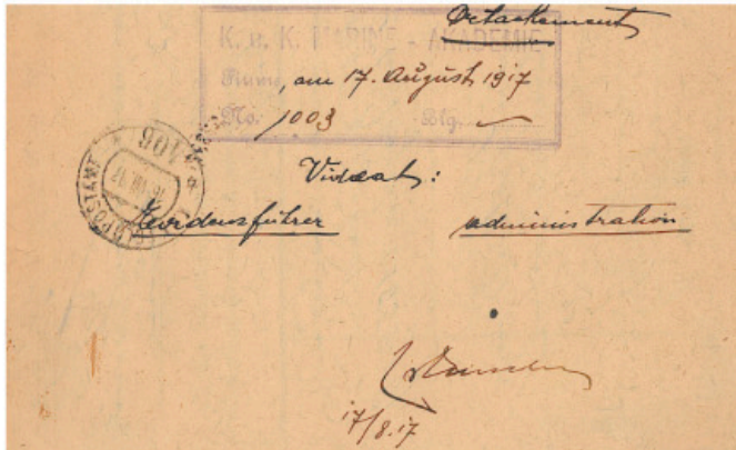
Obr. 9. Pohlednice, odeslaná z Fiume (1917), s otiskem razítka místní cenzurní stanice.