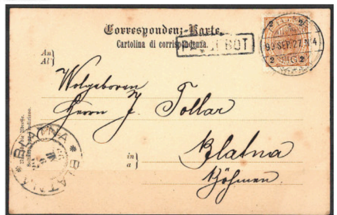
Obr. 5 Pohlednice, podaná na palubě rakouské lodi, plující do Rijeky roku 1899 (viz přidavné razítko „PAQUEBOT“ / parník); zásilka předána rijecké poště k další dopravě, pošta frankaturu uznala a známku orazila svým poštovním razítkem.