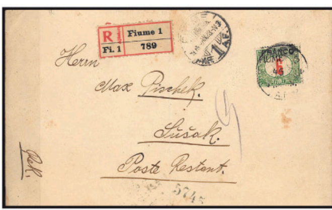
Obr. 10. Pohlednice, odeslaná z Fiume (1917), s otiskem razítka místní cenzurní stanice.

... a v září 1919 podnikl na Rijeku vojenský útok italský revolucionář Gabriele d'Annunzio, který chtěl město a jeho okolí kvůli místní významné italské národnosti menšíne připojit k Itálii. Od roku 1919 do roku 1921 zde vytvořil tzv. „Svobodný stát Rijeka“ (obr. 10, str. 24), který nebyl součástí Chorvatska (SHS, budoucí Jugoslávie), ale vzhledem k mezinárodnímu odporu se nestal ani součástí Itálie a fungoval prakticky jako separovaný městský stát, vedený diktátorem. Došlo dokonce k rozdělení města Rijeki, kdy se po d'Annunziově útoku oddělilo od zbytku města předměstí Sušak s převahou slovanského obyvatelstva, které se obratem připojilo