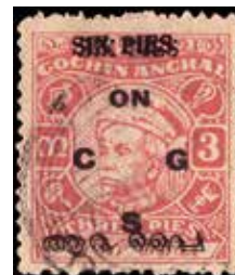
Obr. 52 – dvojitý hodnotový přetisk