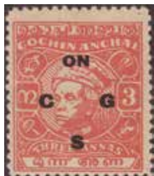
Obr. 46 – 3a