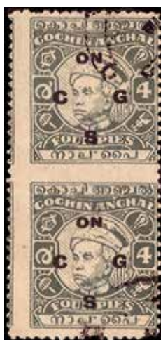
Obr. 48 – vynechaná perforace