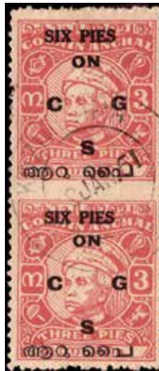
Obr. 53 a 54 – vynechané zoubkování, na obr. 54 – horní známka s jiným znakovým místem On C G S