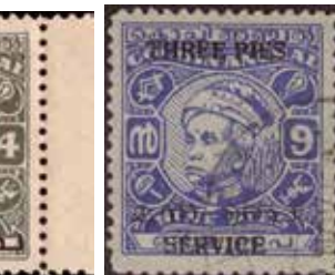
Obr. 56 – s přetiskem SERVICE