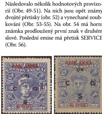
Obr. 49 a 50 – hodnotová provizoria místo On C G S