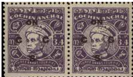
Obr. 47 – varianta On C C S