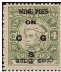
Obr. 51 – 4p