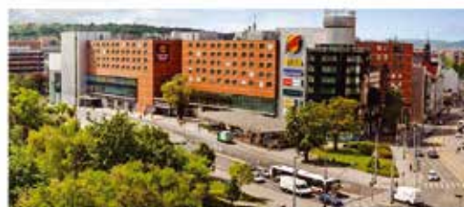
Clarion Congress Hotel

Programu se budou účastnit česky a anglicky hovořící vedoucí a bude probíhat každý den po celou otevírací dobu (od 9 do 17hodin).