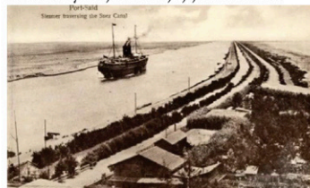
Obr. 46 Krajina u Adenu

Jemenu, ktorú kráľovná so sebou, sa pokúsila odísť už stredy cieľ Augustus, pokračo sa to však až Peršanom. V 6. a 7. storočí bol Jemenu časťou Perzkej ríše. Následne oblasť kontrolovali islámski kráľovstvá. Po páde prvého kalifátu sa sever Jemenu dostal pod vládu imámov rôznych dynastií, ktoré pohľadli základy turkmenickej politikkej štruktúry, postúpajúcej doľnu. Egypťania ovládli kalifom obkopať v 11. storočí sever Jemenu. V 16. a potom v 19. storočí bol sever Jemenu súčasťou Osmanskej ríše a v niektorých obdobiach jej imámovia ovládali aj jeho juh. Povstanie, ktoré vypuklo v krajine roku 1904, jej prinieslo nezávislosť a vznik Jemenského kráľovstva. Roku 1962 došlo k zvrhnutiu posledného despotického imáma a k vytvoreniu Jemenskej arabskej republiky. V 80. rokoch 20. storočia pustošila krajinu občianska vojna, ktorá mala ničivé následky najmä na jej južnú časť.