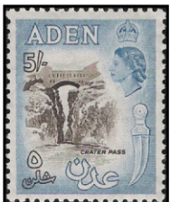
Obr. 33 Vstup do Crateru

Cesta, ktorá spája Crater so severnými časťami polostrova, v minulosti prechádzala úzkou skalnou bránou, premostenou klenbovým oblúkom (CSG 67; Vstup do Crateru; obr. 33). V revolučnom roku 1963 kompetentní činitelia rozhodli, že cestu treba rozšíriť. Gate of Aden, ako sa vstup do mesta nazýval, vtedy jednoducho vyhodili do vzduchu.