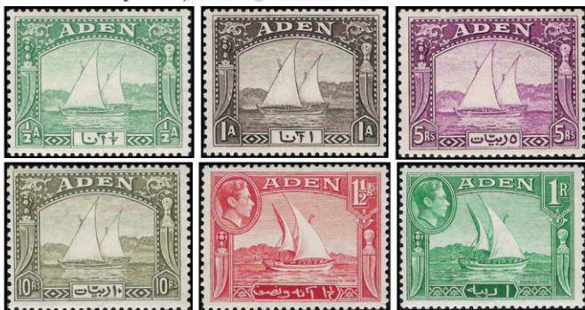
Obr. 34 – 39 Adenská plachetnica

Ľudia arabská plachetnica dhow s ostrovmi Adenom a taposou koromou, dvoma stožiarmi a lichobežníkovými plachtami, o nosnosti 150 až 300 ton (CSG 41, 45, 12, 19, 24, 27; Adenská plachetnica; obr. 34 – 40), je súčasťou náden na viacerých miestach, ale aj na ostrove koromnej kolónie Aden (obr. 41). Roku 1930 sa začalo v lodnici Maalla so stavbou piatich nových plachetníc dhow, čo bolo ako vždy sprevádzané veľkou záľivosťou (CSG 42; Stará plachetnica; obr. 42). Pre stavbu potom takáto oceň. Následne boli plachty nahradené motorami. Prvá dhow s dieselovým pohonom bola postavená roku 1936, zostali však ešte ďalšie dvomi. V prístavu vopý zúčastňovali všetky silničné RAF prúdili juhovýchodného Adenu.