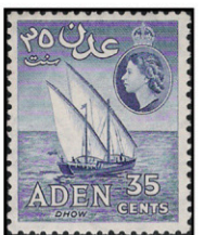
Obr. 40 Adenská plachetnica