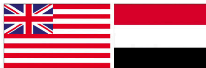
Obr. 44 Zástava britskej východoindickej spoločnosti (1825 a 4.)