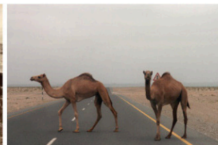
Obr. 47 Ťavy na ceste

Teritória Jemenskej republiky je 527 470 km 2 a má viac než 23 miliónov obyvateľov. Hlavným mestom je Sana. K jej teritóriu patria aj ostrovy Socotra ležiace 350 kilometrov na juh od pobrežia východnej Afriky. Oficiálnym jazykom je arabčina. Jemenci si musíme, keď hovorí alebo smieť. Jemenu znamená v arabčine „Krajina po pravej“ čo je „Krajina na východ od Mekky“. Prvá dhowná vláda tam prebehla roku 1907.