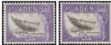
Obr. 42 Stará plachetnica