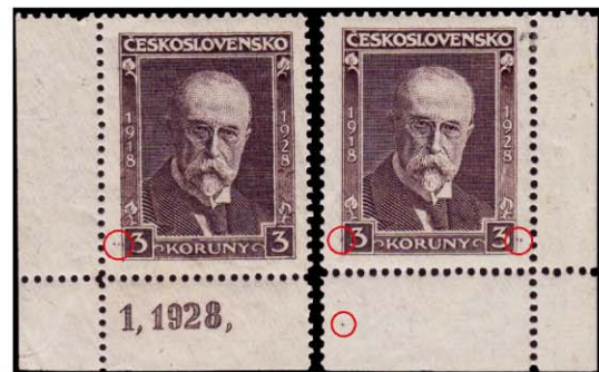
Obr. 3. Prvá známka 3 Kč a prvá známka 3 Kč

Prvá známka 3 Kč vyšla 1. januára 1928 v hodnote 3 Kč. Prvá známka 3 Kč vyšla 1. januára 1928 v hodnote 3 Kč.