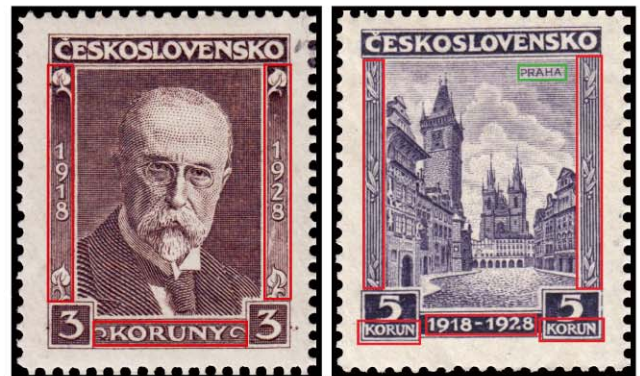
Obr. 2. Prvá známka 3 Kč a prvá známka 5 Kč

Prvá známka 3 Kč vyšla 1. januára 1928 v hodnote 3 Kč. Prvá známka 3 Kč vyšla 1. januára 1928 v hodnote 3 Kč.