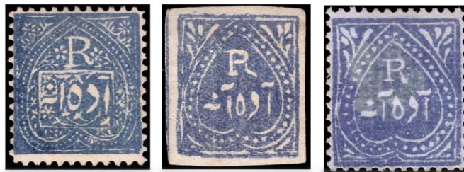
Obr. 20.17 - známky vydané jednotlivci pro veřejnou poštu. Tato známka byla vydána v roce 1941 a byla velmi krásná a byla používána jako prostředek pro komunikaci mezi jednotlivci.

Kromě známek vydávaných pro veřejnou poštu vydávali i jednotlivci známky pro sebe. Tyto známky byly často velmi krásné a byly používány jako prostředek pro komunikaci mezi jednotlivci. Tyto známky byly často velmi krásné a byly používány jako prostředek pro komunikaci mezi jednotlivci. Tyto známky byly často velmi krásné a byly používány jako prostředek pro komunikaci mezi jednotlivci.