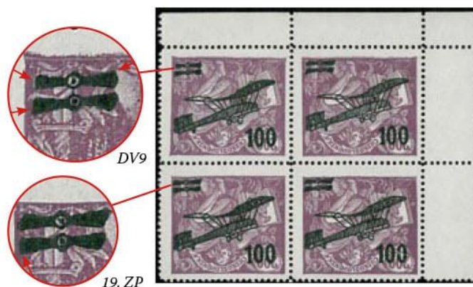
DV9 – zkrácení a deformování vrtule letadla Další čtyřlístek v původní polose přetisku. Pozice přetisku 9, 10, 19, 20 ZP